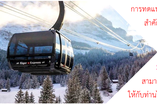
ลูกค้า เป็นสำคัญ)

เที่ยว บริการอาหารกลางวัน ณ ภัตตาคารอาหารท้องถิ่น สดพิเศษบริการอาหารกลางวันบนยอดเขาจุงเฟรา (6) (กรณีร้านอาหารบนยอดเขาจุงเฟราไม่สามารถรองรับคณะได้ ไม่ว่าจะกรณีใดก็ตาม ทางบริษัทขอสงวนสิทธิ์นำท่านรับประทานอาหารที่ภัตตาคารในเมืองใกล้เคียงเป็นการทดแทน และไม่สามารถคืนค่าใช้จ่ายให้ท่านได้ไม่ว่าส่วนใดส่วนหนึ่ง ทั้งนี้ทางบริษัทจะคำนึงถึงประโยชน์ของลูกค้า เป็นสำคัญ)